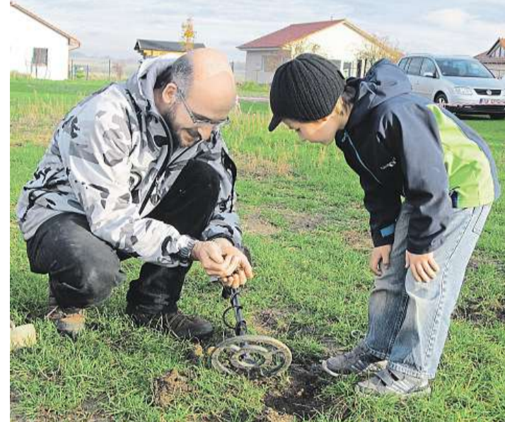
Pod zemí Detektory kovů jsou jednou z pomůcek archeologů. Na pozemcích parku mohou návštěvníci pomocí nich hledat v zemi kovové poklady.

● Do Ledčic se pohodlně dostane autem, vlakem i autobusem.